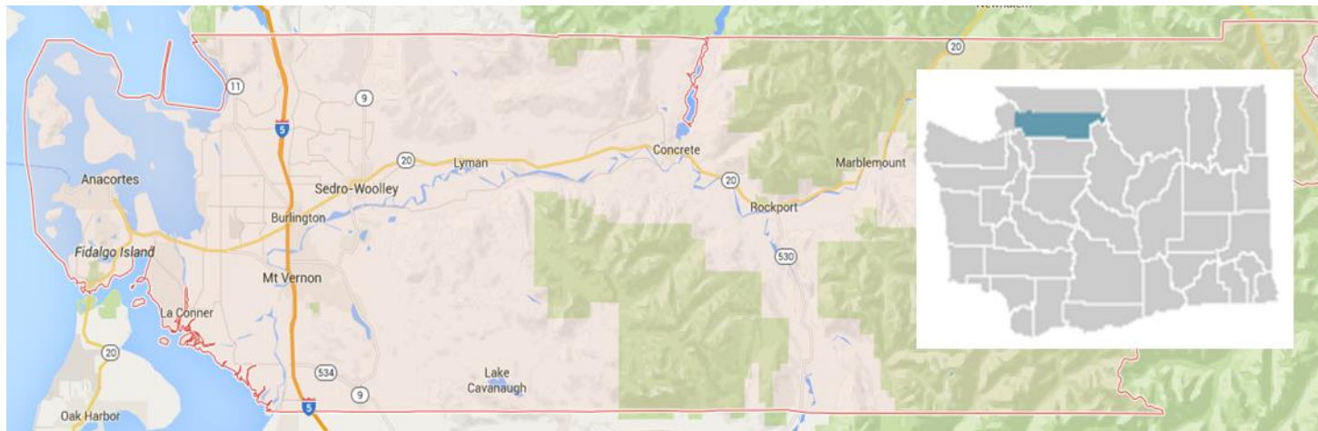
Figura 2: Mapa del condado de Skagit

¿Qué aprendimos? La población del Condado tiene distintos subgrupos, cada uno de los cuales necesita atención en la planificación de la salud. Por ejemplo, los esfuerzos para mejorar la salud tendrán que apoyar a las personas que viven en los dos ámbitos comunitarios: urbano y