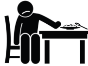
Pérdida de Apetito