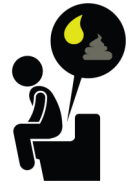
Orina oscura, heces pálidas y diarrea

Algunas personas con Hep A no presentan ningún síntoma.